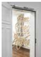
33/ Jenny Feldmann Zeichnung, Siebdruck, Installation www.jennyfeldmann.de jenny.feldmann