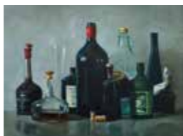
26/ Marlo Klinnert Ölmalerei, Zeichnung, Wandmalerei Demolierung 5, Ratzeburg www.marloklinnert.com marloklinnert