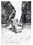
25/ Hans Hinnerk Rohde Malerei, Graphik, Objekte Floggensee 10, Neritz www.hanshinnerkrohde.jimdofree.com ★ Sa., 14–17 Uhr: Öffentliche Musikprobe der Folksdorfer