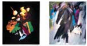
33/ Despoina Pagiota Malerei www.despoinapagiota.com despina_pii